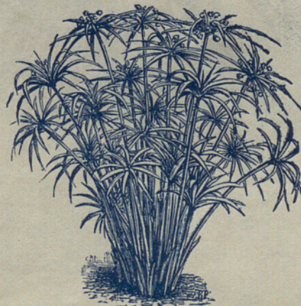
Cyperus alt. nanus