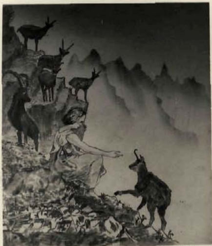
— y los floridos pastos se cubren de venado... —

Ana empieza a lamentar la soledad. Se dirige a los genios de la montaña Les pide consejo y ayuda . Pero quien ? sino los espíritus del mal Duendes, diablejos, almas en pena, Que persiguen a los pastores Y a los caminantes extraviados, Poblarian las cimas nevadas Y los inhospitos ventisqueros ?