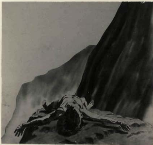
ya esta figido...

Ya se murio el pastor De añoranza y de frio . Ya esta figido como las vacas de su rebaño Y nada ven sus bellos ojos abiertos y helados .