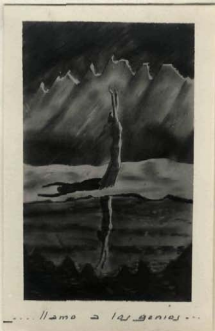
...llamo a los genios...

Pero la Dama Blanca ya no puede deshacer el embrujo La infidelidad de Ruedi Lleno su alma de amargura. Volvio a llamar a sus amigos Genios cornudos y traviesos Que acudieron a su conjuro Y levantaron murallas de hielo Contra las cuales los hombres nada pueden .