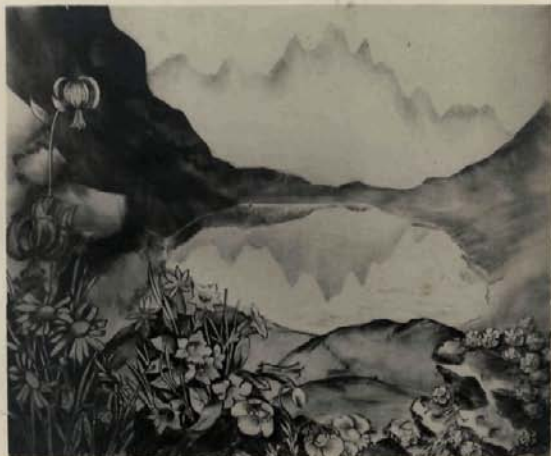
... lago alpestre brillante y quieto...