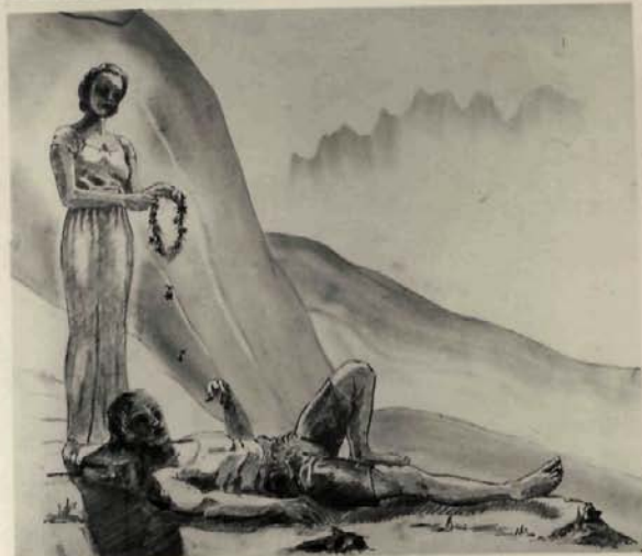
El olvido el resto del mundo...

9 El pastor olvido el resto del mundo, A su (sua) vieja madre, A su joven hermana Y a sus buenos amigos los pastores . Ana le colmo de halagos Y Ruedi no supo si vivia o si soñaba .