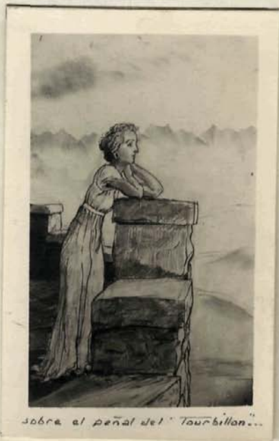
sobre el peñal del "Tourbillon"...

De jóvenes retoños, de pajarillos piadores .