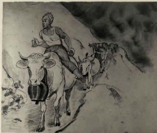
... avanzaba por la senda ...

El joven pastor vacila, reflexiona, Se decide por fin. Reuniendo su rebaño Monta sobre Briini, la vaca preferida, De anchos costados y fino pelo, De ojos dulces y rosado y humedo hocico .