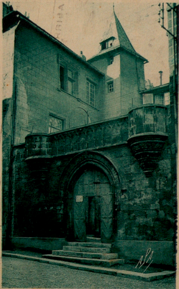
17. RODEZ - Vieille Maison Place Adrien Rozier avec tour d'escalier construite en 1510