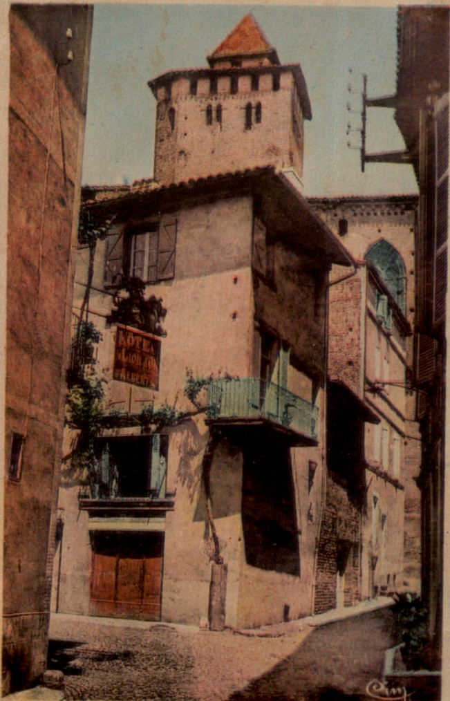
GAILLAC (Tarn) — Place de la Vie et vieille Rue